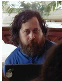
Gambar 1.2 Richard Matthew Stallman