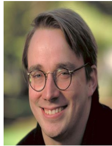
Gambar 1.3 Linus B. Torvalds

mencoba membuat program pada komputer Commodore VIC-20 milik sang kakek.